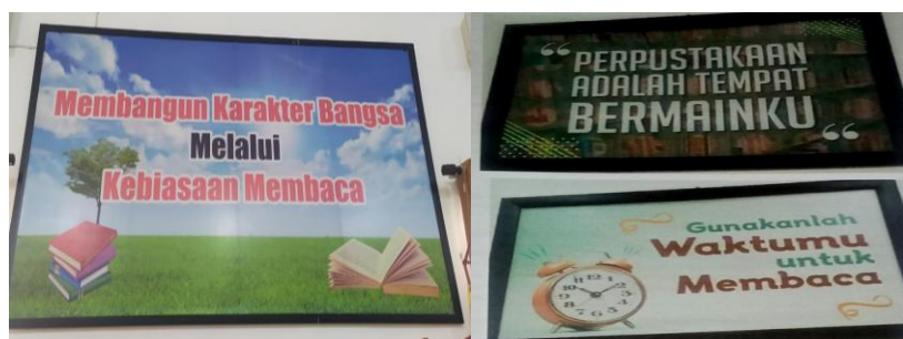
Gambar 3. Gambar 4.3 Kata-Kata Motivasi di Perpustakaan SMK Negeri 3 Palembang

Berdasarkan wawancara dan observasi, motivasi yang diberikan sudah berjalan dengan baik melalui dorongan, bimbingan, dan pendampingan kepada siswa. Perpustakaan juga berusaha menciptakan suasana yang nyaman serta mengembangkan layanan digital agar mudah diakses. Secara keseluruhan, motivasi dari berbagai pihak membuat siswa lebih aktif, percaya diri, serta terbiasa menggunakan layanan perpustakaan digital dalam kegiatan belajar.