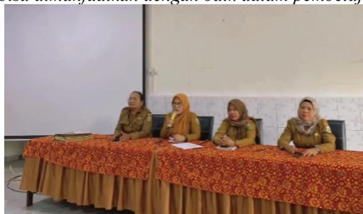
Gambar 4.4 Komunikasi Kepala Perpustakaan dan Rapat Tim

“Saya mengarahkan siswa memanfaatkan perpustakaan digital dan berkomunikasi dengan pustakawan terkait koleksi, sehingga layanan bisa dimanfaatkan dengan baik dalam pembelajaran.”