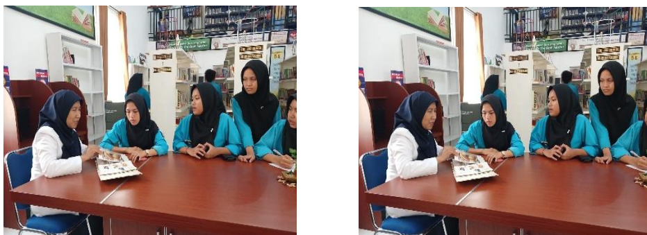
Gambar 1 Koordinasi Melalui Rapat Rutin dan Komunikasi Langsung

Berdasarkan hasil wawancara dan observasi, koordinasi dalam pelaksanaan layanan perpustakaan digital sudah berjalan baik melalui rapat rutin, komunikasi langsung, dan pembagian tugas yang jelas. Kerja sama ini membuat layanan lebih terarah, terintegrasi, dan mendukung kegiatan pembelajaran di sekolah.