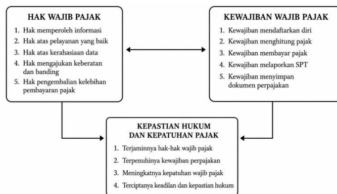
Gambar 2. Hubungan Hak dan Kewajiban Wajib Pajak

Di zaman digital saat ini, wajib pajak tidak hanya mendapatkan pelayanan administrasi, tetapi juga perlindungan terhadap data pribadi dan keamanan sistem informasi, sesuai dengan Undang-Undang No. 6 Tahun 1983 sebagaimana telah diubah terakhir dengan Undang-Undang No. 7 Tahun 2021. Digitalisasi administrasi perpajakan membuat proses pendaftaran, pembayaran, pelaporan, dan konsultasi lebih mudah dilakukan oleh wajib pajak secara online. Namun, kemudahan itu perlu diimbangi dengan perlindungan hukum agar tidak menyebabkan kerugian karena kesalahan sistem atau protokol data (OECD, 2021; Direktorat Jenderal Pajak, 2023).