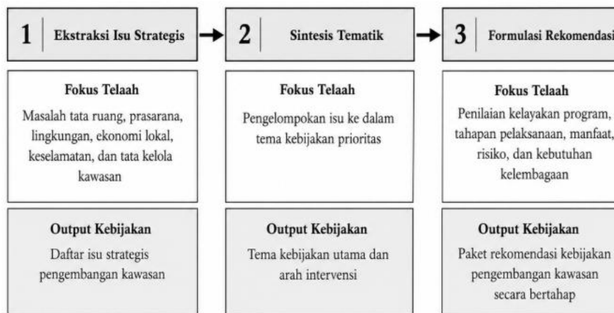
Gambar 1. Kerangka Analisis Policy Brief

Pendekatan analisis dalam artikel ini mengikuti karakter dokumen studi kelayakan yang bersifat normatif, teknis-akademis, dan berbasis perencanaan kawasan. Dokumen tersebut menggunakan telaah kebijakan, pengamatan kondisi eksisting, identifikasi potensi dan masalah, serta penyusunan indikasi program sebagai dasar perencanaan. Oleh karena itu, artikel ini tidak menyusun data primer baru, tetapi mengolah temuan studi kelayakan menjadi analisis kebijakan yang lebih ringkas, terarah, dan mudah digunakan oleh pengambil keputusan. Kerangka analisis digunakan untuk menunjukkan hubungan antara tahapan telaah dokumen, fokus analisis, dan keluaran kebijakan yang dihasilkan, sebagaimana disajikan pada Gambar 1.