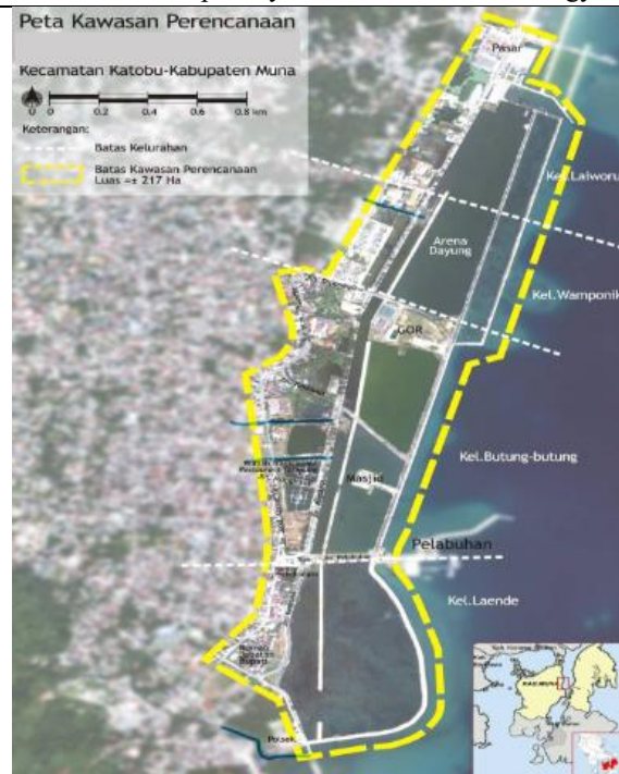
Gambar 1. Peta Batasan Kawasan Perencanaan