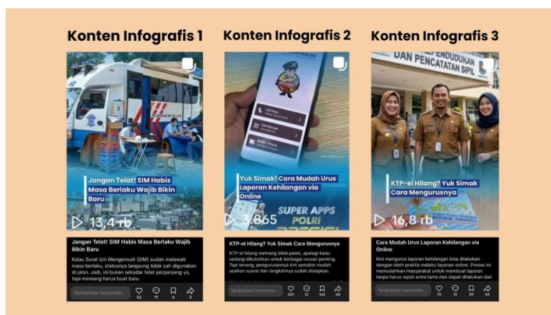
Gambar 1. Jumlah Insight dari Konten Infografis

Secara kelembagaan, langkah adaptif yang diinisiasi oleh TVRI Jawa Barat ini bermuara pada upaya peremajaan citra institusi (institutional rebranding) tanpa sedikitpun mengorbankan mandat luhurnya sebagai penyedia layanan publik. Tantangan eksistensial terbesar bagi media milik negara di era kiwari adalah mempertahankan wibawa edukasi publik sekaligus meraih atensi dari kelompok demografi milenial dan Gen Z. Dalam perspektif komunikasi korporat (Kriyantono, 2020), identitas kelembagaan harus terus direnegosiasikan dan disesuaikan mengikuti semangat zaman ( zeitgeist ) agar tidak mengalami keterasingan kultural di tengah masyarakatnya sendiri. Melalui kehadiran yang persisten, edukatif, dan visual-sentris di media sosial, TVRI Jawa Barat tidak hanya menunaikan kewajiban fungsionalnya secara efektif, tetapi juga berhasil merajut kembali kedekatan emosional dengan publik. Citra yang terbangun kini bukan lagi sekadar "corong pemerintah" yang kuno dan birokratis, melainkan representasi dari sebuah institusi modern yang lincah, kredibel, dan senantiasa hadir mendampingi kebutuhan informasi masyarakat di ujung jari mereka.