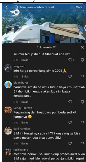
Gambar 3. Feedback Komen Dari Konten Infografis

Gambar 3 menunjukkan tingginya tingkat keterlibatan audiens (audience engagement) juga tercermin dari ruang diskusi di kolom komentar seperti pada gambar yang dilampirkan, menunjukkan feedback dari berupa sebuah komentar yang berisi seperti reaksi, keluhan, serta opini warganet mengenai berita infografis yang diunggah.