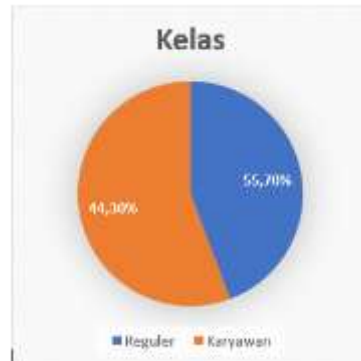
Gambar 3. Karakteristik Responden Berdasarkan Kelas

mahasiswa semester 6 berjumlah 12 mahasiswa atau 15,19%, semester 5 sebanyak 11 mahasiswa atau 13,92%, dan semester 4 sebanyak 10 mahasiswa atau 12,60%. Sementara itu, responden dari semester 3 dan semester 2 memiliki jumlah yang lebih sedikit, sedangkan semester 1 menjadi kelompok dengan jumlah responden paling rendah. Dominasi mahasiswa semester akhir menunjukkan bahwa sebagian besar responden telah memiliki pengalaman akademik dan pemahaman yang lebih baik mengenai dunia perpajakan serta prospek karier di bidang pajak.