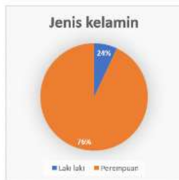
Gambar 1. Karakteristik Responden Berdasarkan Jenis Kelamin

Karakteristik responden dalam penelitian ini diperoleh dari 79 mahasiswa Program Studi Akuntansi Perpajakan Universitas Ngudi Waluyo yang telah mengisi kuesioner pada periode 9 Februari 2026 sampai dengan 15 Februari 2026. Karakteristik responden dianalisis berdasarkan jenis kelamin, semester, dan kelas untuk memberikan gambaran umum mengenai profil responden penelitian.