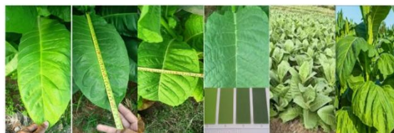
Gambar 2. Pengumpulan Data