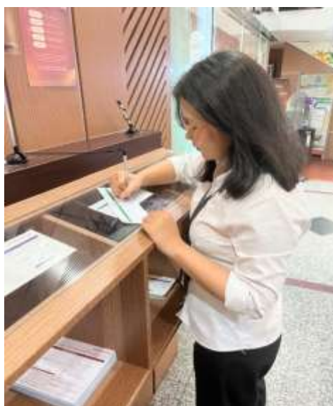
Gambar 5. Membantu proses transaksi sederhana

Mahasiswa turut berpartisipasi dalam membantu pelaksanaan transaksi sederhana, seperti mengantarkan dana kepada teller sesuai dengan prosedur operasional yang berlaku. Kegiatan ini memberikan pengalaman praktis kepada mahasiswa terkait alur transaksi dalam operasional perbankan. Selain itu, kegiatan ini juga berkontribusi dalam meningkatkan rasa tanggung jawab, ketelitian, serta kepatuhan terhadap prosedur kerja yang telah ditetapkan.