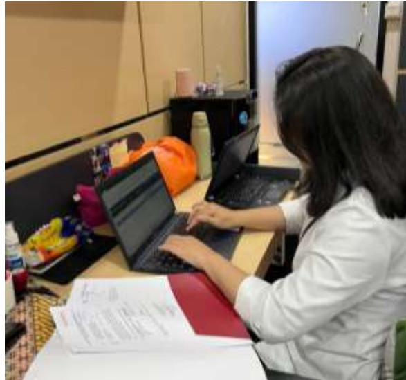
Gambar 2. Registrasi Surat Masuk dan Keluar

Kegiatan ini dilaksanakan sesuai dengan prosedur administrasi yang berlaku di instansi. Mahasiswa bertanggung jawab untuk melakukan pencatatan terhadap setiap surat masuk dan surat keluar secara sistematis dan terstruktur, sehingga seluruh dokumen dapat terdokumentasi dengan baik. Melalui kegiatan ini, mahasiswa memperoleh pemahaman yang lebih mendalam mengenai pentingnya tertib administrasi dalam mendukung efektivitas serta kelancaran alur informasi dan komunikasi dalam organisasi.