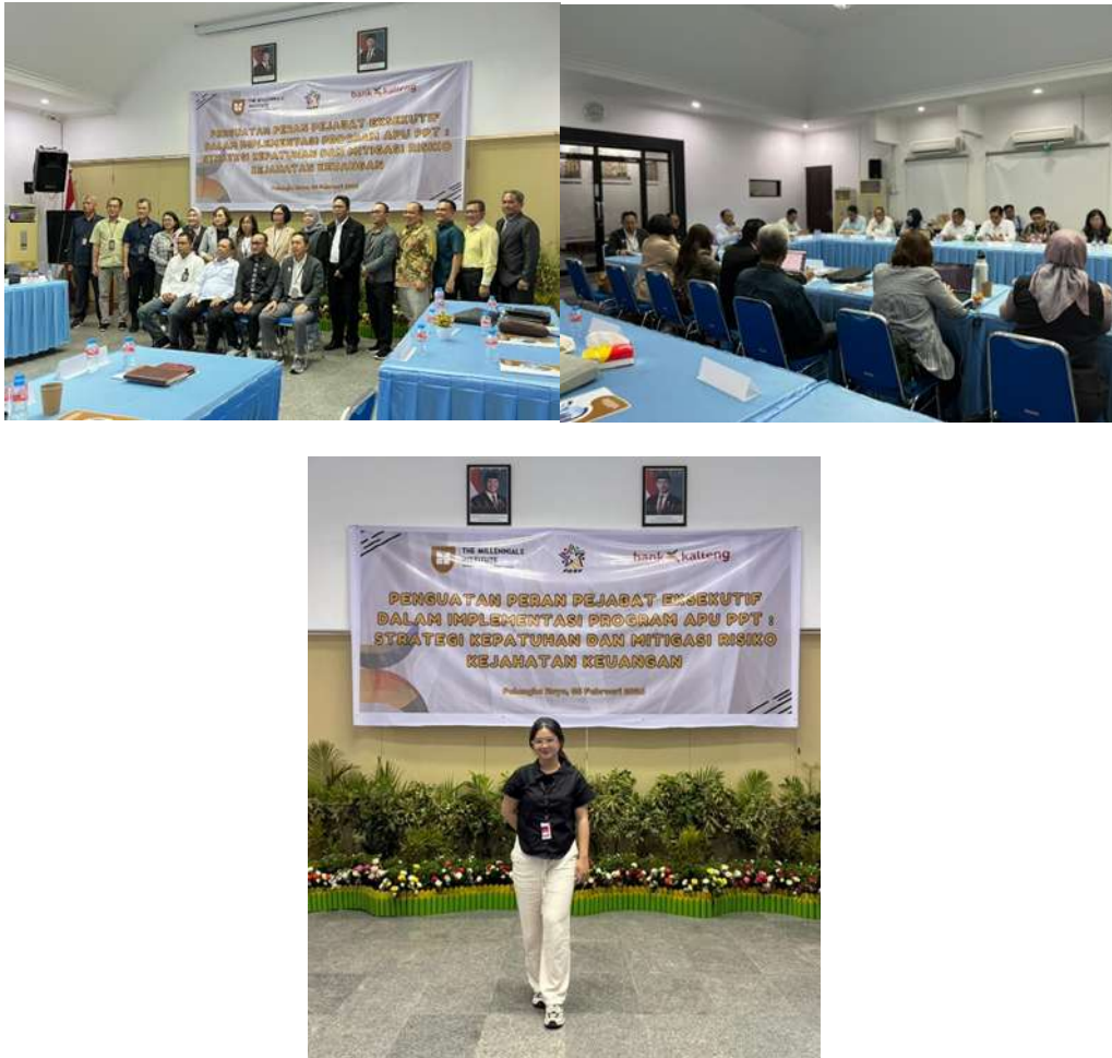
Gambar 6. Penguatan Peran Pejabat Eksekutif Dalam Implementasi Program APU PP: Strategi Kepatuhan dan Mitigasi Risiko Kejahatan Keuangan

Aktivitas lainnya yang dilakukan selama kegiatan magang yaitu mengikuti kegiatan Penguatan Peran Pejabat Eksekutif dalam Implementasi Program APU PPT: Strategi Kepatuhan dan Mitigasi Risiko Kejahatan Keuangan . Melalui kegiatan ini, mahasiswa memperoleh pemahaman yang lebih komprehensif mengenai pentingnya penerapan prinsip Anti Pencucian Uang dan Pencegahan Pendanaan Terorisme (APU PPT) dalam mendukung kepatuhan serta memitigasi risiko kejahatan keuangan dalam operasional perbankan.