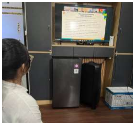
Gambar 7. Pelatihan APU PPT & PPPSPM PT Bank Kalteng: Tantangan dan Peran Bank Dalam Menghadapi Kejahatan Keuangan Terkini