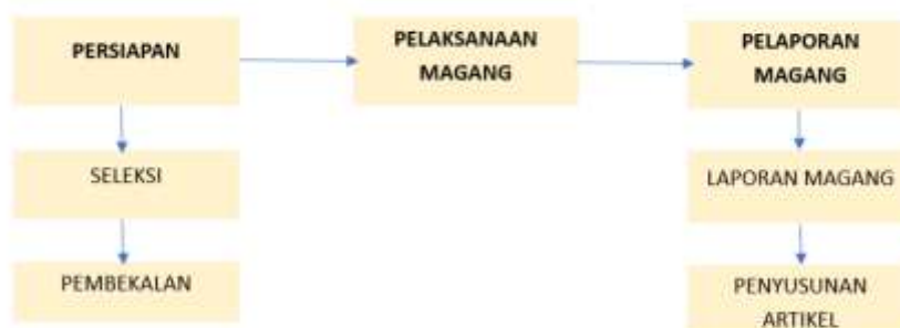
Gambar 1. Tahap Kegiatan Magang

Metode pelaksanaan kegiatan magang ini disusun secara sistematis melalui beberapa tahapan yang saling berkaitan, dimulai dari tahap persiapan, pelaksanaan, hingga pelaporan. Setiap tahapan dirancang untuk memastikan bahwa kegiatan magang dapat berjalan secara terarah dan efektif, serta memberikan pengalaman dan pembelajaran yang optimal bagi mahasiswa.