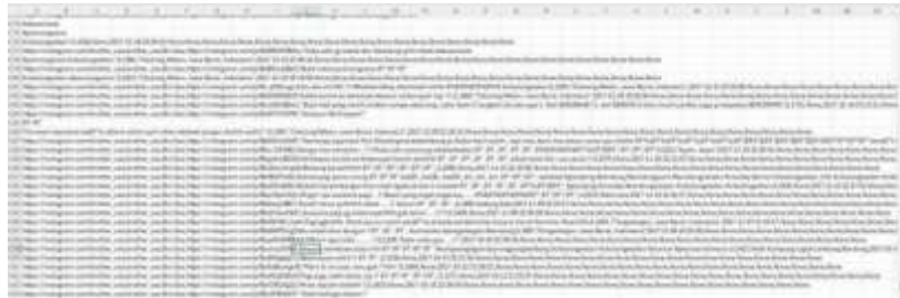
Gambar 2. Hasil Scraper