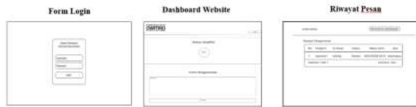
Gambar 3.2 Rancangan Website

Gambar 3.2 menunjukkan tampilan antarmuka website yang digunakan dalam sistem pemberian informasi dari kantor desa ke masjid. Tampilan pertama merupakan halaman login yang berfungsi sebagai akses masuk bagi pengguna dengan memasukkan username dan password. Setelah berhasil login, pengguna diarahkan ke halaman dashboard yang menampilkan status amplifier serta form pengumuman yang digunakan untuk memasukkan informasi yang akan dikirim ke masjid. Selanjutnya, terdapat halaman riwayat pesan yang berfungsi untuk menampilkan daftar pengumuman yang telah dikirim, lengkap dengan informasi pengirim, isi pesan, status, dan waktu pengiriman, sehingga memudahkan pengguna dalam memantau aktivitas sistem secara keseluruhan.