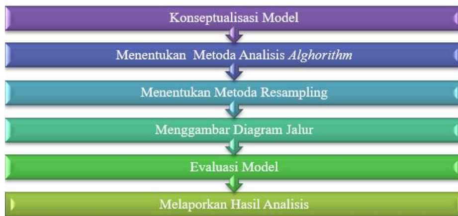
Gambar 2. 1 Tahapan Analisis SEM-PLS

Adapun beberapa langkah analisis (Latan dan Ghozali, 2017) dengan menggunakan SEM-PLS ( Structural Equation Modelling-Partial Least Square ) tersebut dapat dilihat pada gambar 3.1 berikut ini: