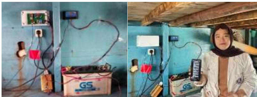
Gambar 1 Uji Coba Alat