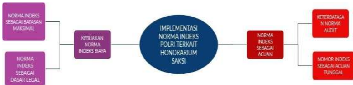
Gambar 4. 2 Implementasi Norma Indeks

Hasil penelitian menemukan bahwa implementasi pembayaran honor saksi ahli di lingkungan Polda Jawa Timur secara administratif mengacu pada Norma Indeks Polri. Norma Indeks digunakan sebagai pedoman standar biaya, termasuk batas maksimal honor saksi ahli sebesar Rp1.800.000 per kehadiran/kegiatan. Implementasi ini tampak mulai dari perencanaan, pelaksanaan, hingga pertanggungjawaban.