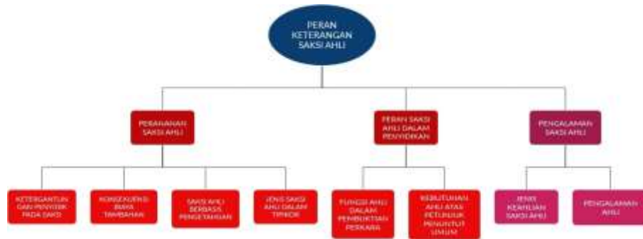
Gambar 4. 1 Peran Keterangan Saksi Ahli

Berdasarkan hasil wawancara dengan Kopol Dr. Eko N. W, SH., M.Kes, informan menjelaskan bahwa kedudukan dan peran saksi ahli dalam proses pembuktian pada dasarnya bersifat membantu aparat penegak hukum dalam memahami aspek-aspek teknis tertentu yang tidak dapat dijelaskan secara memadai hanya melalui keterangan saksi biasa maupun kemampuan penyidik. Informan menegaskan bahwa peran utama yang dilakukan adalah menilai urgensi penggunaan saksi ahli dalam suatu perkara, yaitu dengan mempertimbangkan alasan mengapa suatu kasus memerlukan saksi ahli serta apakah perkara tersebut memiliki tingkat kerumitan tertentu sehingga membutuhkan keahlian khusus.