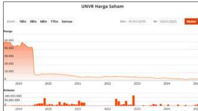
Gambar 1. Grafik Pergerakan Harga Saham UNVR Periode 2020-2024

Salah satu contoh yang mencerminkan fenomena tersebut adalah penurunan harga saham PT Unilever Indonesia Tbk (UNVR). Berdasarkan data IDN Financials (2025), harga saham UNVR mengalami tren penurunan sejak tahun 2020 hingga 2025. Penurunan ini menunjukkan adanya perubahan persepsi investor terhadap kinerja perusahaan. Meskipun UNVR merupakan perusahaan besar dengan reputasi yang kuat, namun penurunan harga saham tersebut mengindikasikan bahwa investor mulai meragukan prospek pertumbuhan perusahaan di masa depan.