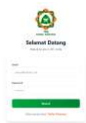
Gambar 1. Halaman Login

Antarmuka sistem diawali dengan halaman login dan dashboard utama yang digunakan sebagai pusat navigasi pengguna dalam mengakses fitur sistem. Melalui halaman login, pengguna dapat masuk ke dalam sistem sesuai hak akses masing-masing. Setelah proses autentikasi berhasil dilakukan, pengguna diarahkan ke halaman dashboard yang menyediakan menu pengelolaan data serta akses terhadap fitur utama sistem. Tampilan halaman login dan dashboard guru ditunjukkan pada Gambar 1 dan Gambar 2.