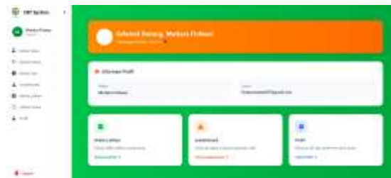
Gambar 2. Dashboard Guru

Selanjutnya sistem menyediakan halaman pengelolaan data siswa serta pengelolaan data kriteria sebagai parameter dalam proses perhitungan metode SAW. Halaman ini berfungsi untuk menambahkan, mengubah, dan mengelola data yang digunakan dalam proses penilaian tingkat kemahiran siswa secara sistematis. Tampilan halaman pengelolaan data siswa dan data kriteria ditunjukkan pada Gambar 3 dan Gambar 4.