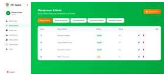
Gambar 4. Kelola Kriteria

Pada sisi pengguna siswa, sistem menyediakan halaman latihan soal CBT yang digunakan untuk mengerjakan soal secara mandiri serta halaman hasil pengolahan sistem yang menampilkan klasifikasi tingkat kemahiran siswa berdasarkan metode SAW ke dalam kategori Mutqin, Fasih, atau Mujtahid. Selain itu, sistem juga menyediakan fitur leaderboard sebagai informasi peringkat hasil latihan siswa. Tampilan halaman Latihan Soal Siswa dan leaderboard ditunjukkan pada Gambar 5 dan Gambar 6.