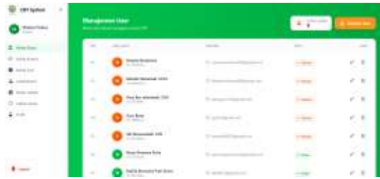
Gambar 3. Kelola Siswa