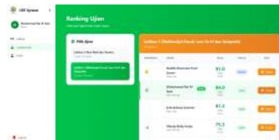
Gambar 6. Leaderbord Siswa

Secara keseluruhan, tampilan antarmuka sistem dirancang sederhana dan terstruktur agar memudahkan pengguna dalam mengoperasikan sistem serta mendukung proses penentuan tingkat kemahiran siswa secara objektif dan sistematis melalui penerapan metode SAW.