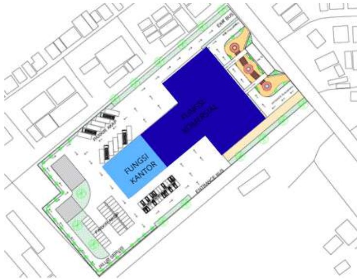
Gambar 3 Scematic Layout Zoning Lantai 2

Gambar 3 merupakan rencana denah lantai dua dari kawasan terminal yang memperlihatkan pengembangan fungsi bangunan secara vertikal. Pada lantai ini, tata ruang didominasi oleh zona fungsi komersial dan fungsi kantor, yang menunjukkan adanya pemisahan yang lebih jelas antara aktivitas publik utama di lantai dasar dan aktivitas pendukung di lantai atas.