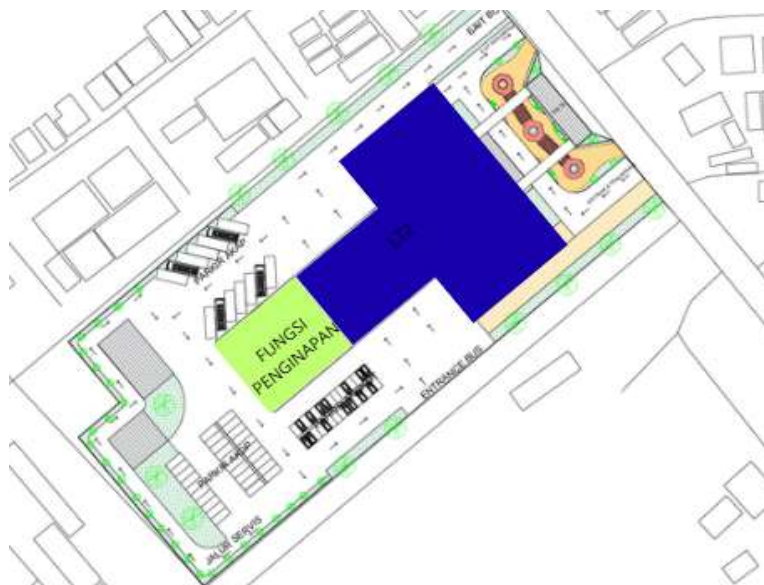
Gambar 4 Scematic Layout Zoning Lantai 3

Zona fungsi kantor berada di sisi kiri bangunan dan terpisah dari area komersial. Penempatan ini didasarkan pada prinsip zonasi semi-privat hingga privat, di mana ruang administrasi membutuhkan tingkat kontrol akses yang lebih tinggi, suasana kerja yang relatif tenang, serta minim gangguan dari aktivitas publik. Dengan memisahkannya dari zona komersial, efisiensi operasional dan kenyamanan kerja dapat terjaga.