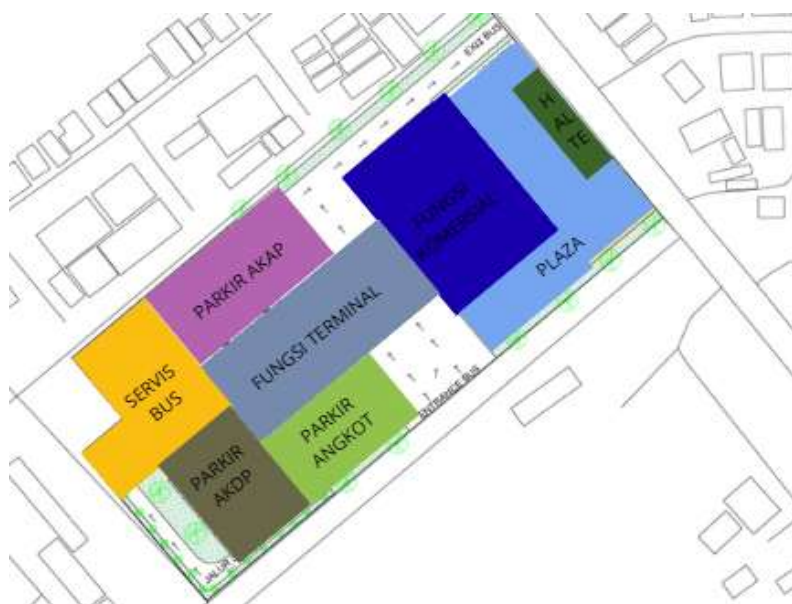
Gambar 2 Scematic Layout Zoning Ground Plan

Gambar 2 menunjukkan ground plan dari kawasan terminal yang disusun berdasarkan prinsip zonasi fungsional dan hierarki sirkulasi. Tata letak massa bangunan dan area parkir memperlihatkan pemisahan yang jelas antara zona operasional kendaraan, zona pelayanan penumpang, dan zona komersial. Pembagian ini bertujuan untuk menciptakan sistem pergerakan yang efisien, meminimalkan konflik antara kendaraan besar dan pejalan kaki, serta meningkatkan kenyamanan dan keselamatan pengguna.