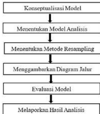
Gambar 2.1 Tahapan Analisis SEM PLS Sumber : Ghozali,dkk (2017)

Adapun beberapa langkah analisis dengan menggunakan SEM PLS (Structural Equation Modeling-Partial Least Square) tersebut dapat dilihat pada gambar 3.1 berikut ini: