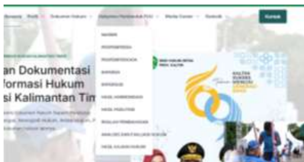
Gambar 5 Dokumentasi hukum dalam sistem JDIH

Implementasi Jaringan Dokumentasi dan Informasi Hukum (JDIH) di Provinsi Kalimantan Timur menghadapi sejumlah tantangan kelembagaan yang berkaitan dengan koordinasi antar lembaga, kapasitas pengelolaan sistem informasi hukum, serta pemenuhan standar nasional pengelolaan dokumentasi hukum. Portal JDIH Provinsi Kalimantan Timur menyediakan berbagai jenis dokumen hukum seperti peraturan perundang-undangan, monografi hukum, artikel hukum, dan putusan pengadilan yang dapat diakses secara terbuka oleh masyarakat. Sistem ini dirancang sebagai platform terpadu untuk menghimpun dan menyediakan informasi hukum secara sistematis sehingga memudahkan pencarian dan pemanfaatan produk hukum daerah oleh publik.