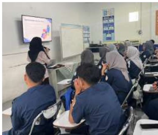
Gambar 1. Sesi Ceramah dan diskusi