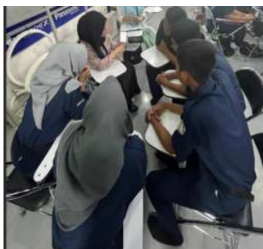
Gambar 2. Sesi Pelatihan dan Pendampingan