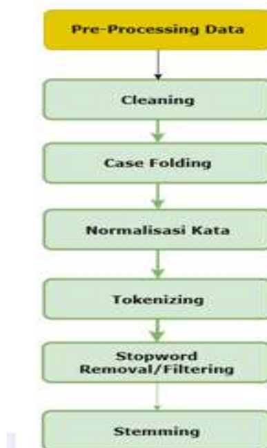
Gambar 1. Pre-processing Data

Tahapan preprocessing memiliki peran penting dalam meningkatkan kualitas data teks sebelum dilakukan proses klasifikasi. Proses seperti cleaning, tokenizing, stopwords removal, dan stemming dapat mengurangi noise pada data serta membantu model klasifikasi dalam mengenali pola teks dengan lebih baik. Beberapa penelitian menunjukkan bahwa kualitas preprocessing sangat mempengaruhi performa model analisis sentimen pada data media sosial (Hidayah et al., 2024; Pateman et al., 2025).