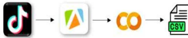
Gambar 2. Proses Ekstraksi Data

Tahapan ini merupakan langkah awal dalam penelitian yang bertujuan untuk memperoleh data mentah berupa komentar pengguna yang kemudian akan diproses lebih lanjut pada tahap preprocessing.