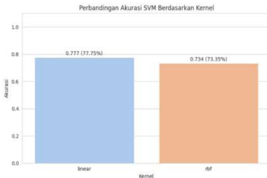
Gambar 5. Perbandingan Hasil Klasifikasi SVM Kernel Linear dan RBF

Model SVM dengan kernel Linear menghasilkan akurasi sebesar 77,75%, sedangkan kernel RBF menghasilkan akurasi sebesar 73,35%.