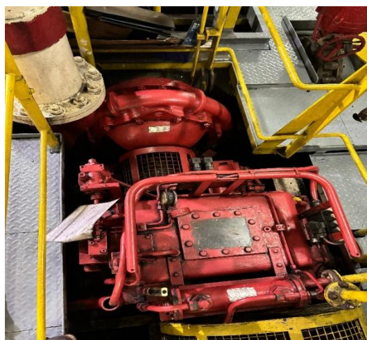
Gambar 1. Fire Fighting Pump