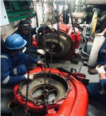
Gambar 4. Sentrifugal Pump