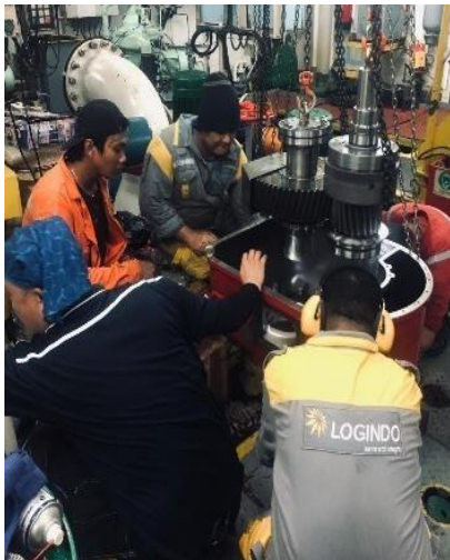
Gambar 2. Pembongkaran Gear Box

Berikut merupakan dokumentasi penulis selama melakukan prala dan berada pada engine room kapal AHTS. Logindo Sturdy