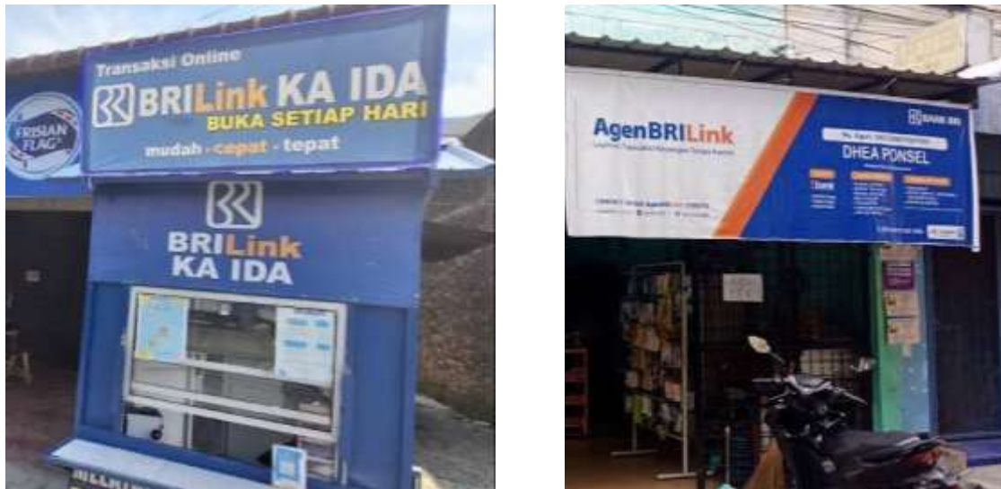
Gambar 1.1 Beberapa Agen BRILink di Kec. Medan Johor

Berikut ini dipaparkan tabel jumlah pertumbuhan agen BRILink di Kec. Medan Johor selama 5 tahun terakhir: