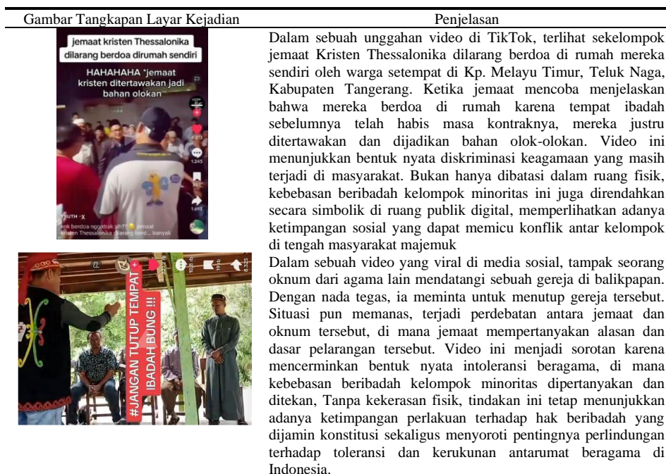
Tabel 2. Hasil Observasi Melalui Platform TikTok