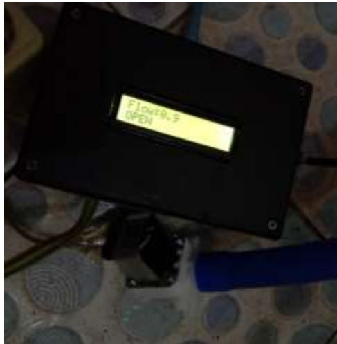
Gambar 6. Pengujian Tampilan LCD

Tabel ini menguji tampilan informasi pada LCD I2C, termasuk debit air, status valve, dan informasi lainnya. Tabel ini menunjukkan apakah data yang ditampilkan pada LCD terbaca dengan jelas dan dalam kondisi normal.