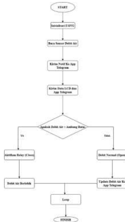
Gambar 1. Flowchart Sistem

Gambar ini menunjukkan alur kerja meteran air digital berbasis IoT, mulai dari pembacaan sensor, pengolahan data oleh ESP32, hingga pengiriman notifikasi dan kontrol aliran air.