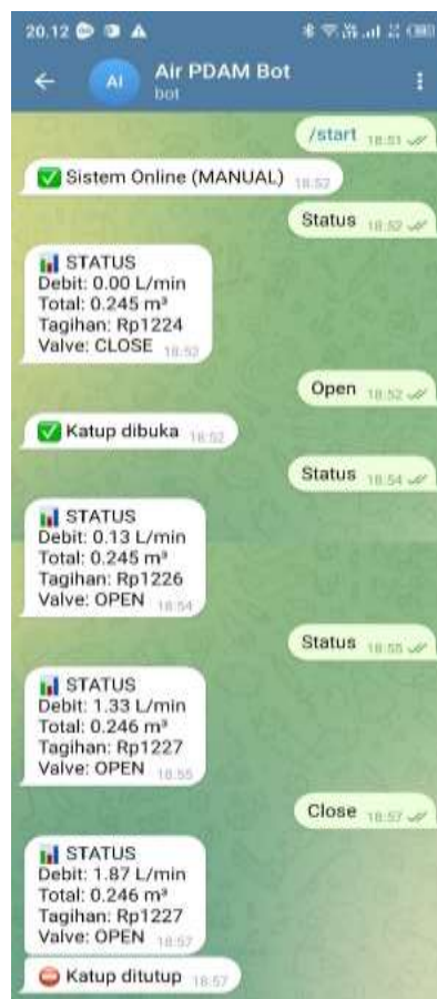
Gambar 5 Output Ke App Telegram

Berikut adalah gambar output dari sensor ke aplikasi Telegram sebagai berikut: