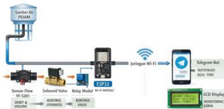
Gambar 2 Rangkaian Sistem Meteran Air Berbasis IOT

Berikut adalah skema gambaran alur kerja rangkain system meteran air berbasis IOT :