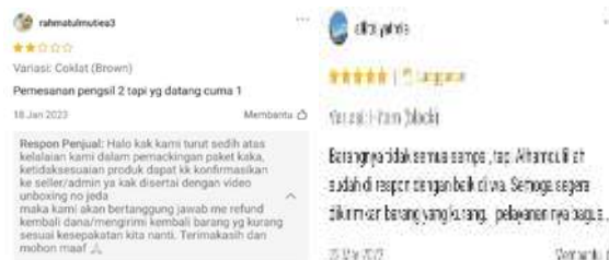
Gambar 3. Penerapan Prinsip EBI Terkait Tanggung Jawab

Tanggung Jawab (Responsibility) merupakan kewajiban yang harus ada pada setiap orang. Setiap orang yang menjalankan aktivitas bisnis harus memiliki rasa tanggung jawab baik itu pada diri sendiri, karyawan, lingkungan, maupun pembeli.