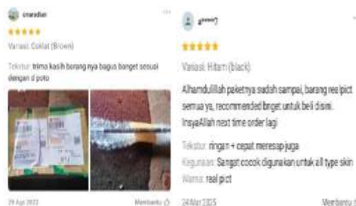
Gambar 4. Penerapan Prinsip EBI Terkait Kebenaran

Pada prinsip etika bisnis islam, kebenaran (ihsan/benevolence) dalam transaksi jual beli online di aplikasi Shopee adalah suatu ketaatan yang dilakukan untuk menghindari kerugian dan menciptakan keridhaan terhadap pembeli dan penjual. Kebenaran dalam transaksi jual beli online di aplikasi Shopee di kaitkan pada kejujuran atas semua informasi terkait produk yang diperjual belikan. Hal tersebut berkaitan pada memberikan keterangan mengenai kekurangan yang ada pada produk, menampilkan gambar produk yang real tanpa editan yang berlebihan untuk menghindari ekspektasi pembeli, dan lain sebagainya.