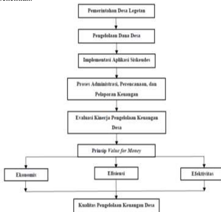
Gambar 2.2 Kerangka Penelitian

Kerangka penelitian menghubungkan konsep utama penelitian: (1) implementasi SISKEUDES, (2) prinsip Value for Money, dan (3) kinerja pengelolaan Dana Desa. Implementasi SISKEUDES diperkirakan memengaruhi pencapaian ekonomi, efisiensi, dan efektivitas dalam pengelolaan Dana Desa. Ketiga variabel tersebut menjadi dasar analisis dalam penelitian.