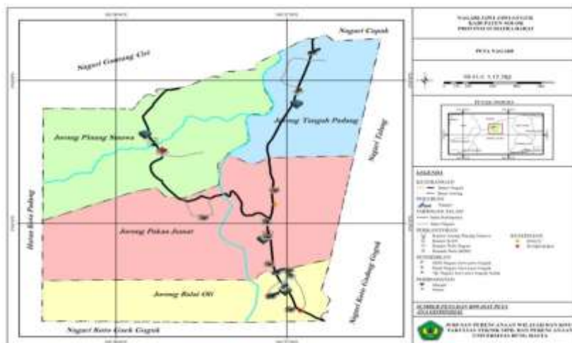
Gambar 2 Peta Wilayah Nagari Jawi-Jawi Guguk Kondisi geografis Nagari Jawi-Jawi

Nagari Jawi-Jawi Guguk merupakan salah satu Nagari yang ada di Kabupaten Solok, Provinsi Sumatera Barat. Luas wilayah Nagari Jawi-Jawi Guguk sebesar ± 149 Km 2 Nagari Jawi-Jawi Guguk terdiri dari 4 Jorong. Nagari Jawi-Jawi Guguk terletak pada Ketinggian Tanah dari permukaan laut dengan Tofografis Suhu Udara Rata-rata 20 C dan Titik Koordinat Nagari : Lintang 0 54'21,611"LS, Bujur : 100 3729,783"BT