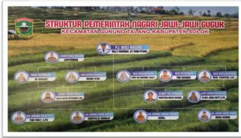
Gambar 3 Struktur Organisasi Kantor Wali Nagari Jawi-Jawi Guguk