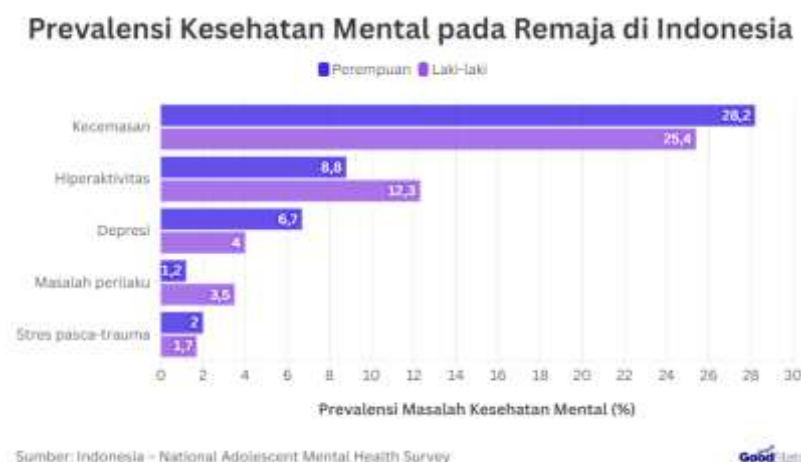
Gambar 2. Data Jumlah Masalah Kesehatan Mental di Indonesia

Salah satu isu yang sering diangkat dalam narasi pemberdayaan perempuan di media sosial adalah kesehatan mental. Tekanan sosial akibat standar kecantikan yang sempit dan budaya perbandingan sosial di media digital berkontribusi pada meningkatnya kecemasan dan ketidakpercayaan diri perempuan (Elviany & Wulandari, 2025). Data Indonesia National Adolescent Mental Health Survey (2024) menunjukkan bahwa 34,9% remaja di Indonesia mengalami masalah kesehatan mental, dengan prevalensi kecemasan yang lebih tinggi pada remaja perempuan dibandingkan laki-laki (lihat Gambar 2). Fakta ini menegaskan urgensi kajian mengenai bagaimana media sosial meringkai isu kesehatan mental perempuan.