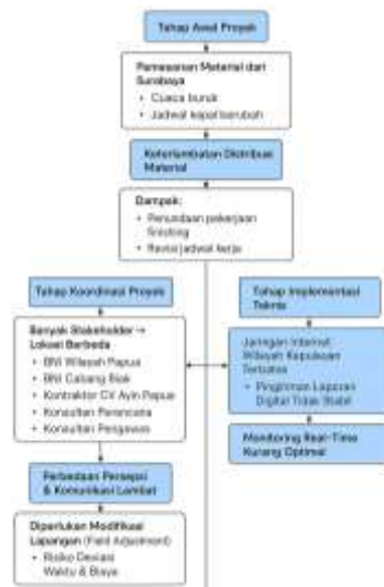
Gambar 3. Diagram alur kendala pelaksanaan proyek relokasi dan renovasi BNI KC Biak

Temuan ini sejalan dengan penelitian Lahay dan Kamaludin (2024) serta Rifaldi (2022) yang menyatakan bahwa proyek di daerah terpencil cenderung menghadapi kendala logistik dan koordinasi yang lebih kompleks dibandingkan proyek di wilayah perkotaan. Namun, dibandingkan dengan penelitian Nyoman et al. (2023) di Bali yang menunjukkan sistem komunikasi digital berjalan optimal, konteks Biak masih menghadapi keterbatasan infrastruktur yang signifikan. Strategi mitigasi risiko meliputi penjadwalan cadangan, pemilihan pemasok alternatif, serta optimalisasi komunikasi digital. Pendekatan ini sejalan dengan Zou et al. (2018) yang menekankan pentingnya mitigasi risiko berbasis pengawasan dalam proyek renovasi kompleks. Berdasarkan hasil wawancara dan observasi lapangan, ditemukan sejumlah kendala utama yang memengaruhi pelaksanaan proyek relokasi dan renovasi BNI KC Biak. Kendala paling dominan adalah keterlambatan distribusi material konstruksi dan interior akibat ketergantungan pengiriman dari Surabaya melalui jalur laut. Kondisi cuaca dan jadwal kapal yang tidak menentu menyebabkan keterlambatan pada tahap pekerjaan finishing. Selain kendala logistik, kompleksitas koordinasi lintas-stakeholder juga menjadi hambatan signifikan. Perbedaan lokasi kerja antara pihak BNI wilayah, kontraktor, dan konsultan menyebabkan keterlambatan pengambilan keputusan teknis, terutama ketika diperlukan penyesuaian desain terhadap kondisi bangunan eksisting.