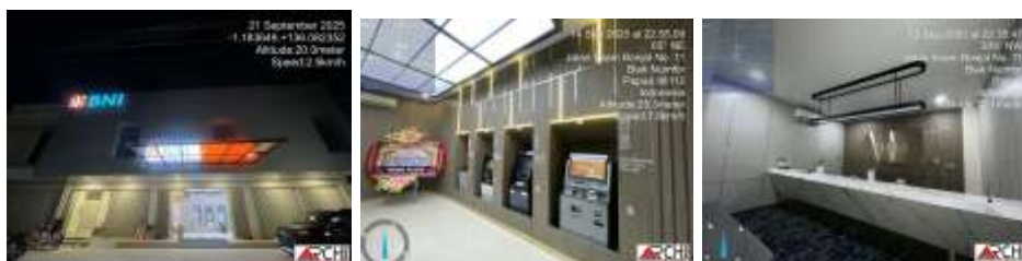
Gambar 4. Penerapan standar arsitektur interior BNI pada ruang pelayanan dan ruang kerja

Menanggapi berbagai kendala tersebut, konsultan pengawas menerapkan strategi optimalisasi yang berfokus pada pemanfaatan sistem monitoring digital, penguatan koordinasi lintas-stakeholder, serta penerapan standar arsitektur interior BNI sebagai acuan utama pengawasan.