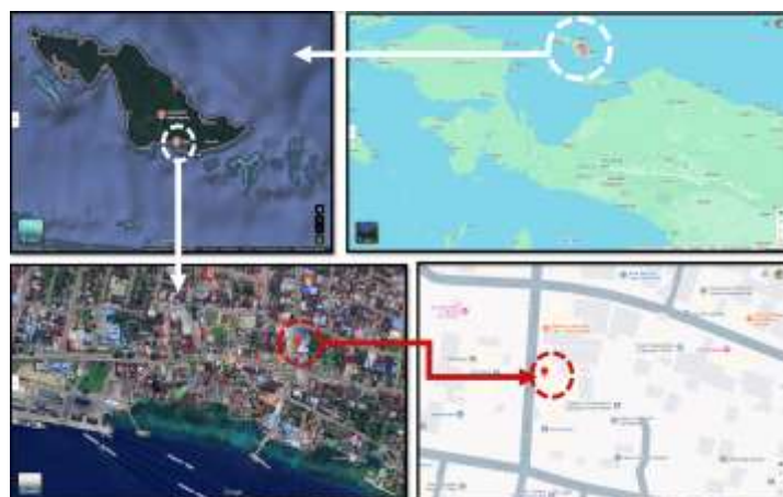
Gambar 1. Lokasi proyek relokasi dan renovasi BNI Kantor Cabang Biak

Gambar 1 menunjukkan lokasi proyek yang berada di wilayah kepulauan Biak, Papua, yang secara geografis memiliki keterbatasan akses logistik dan transportasi. Kondisi ini menjadi faktor eksternal yang memengaruhi efektivitas pengawasan dan pengendalian waktu proyek.