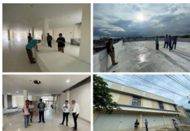
Gambar 2. Kegiatan Meeting Coordination (MC-0) antara konsultan pengawas, kontraktor, dan pihak BNI

Selain itu, pada tahap awal pelaksanaan proyek, konsultan pengawas memfasilitasi meeting coordination (MC-0) sebagai forum penyelarasan teknis antara pihak BNI, kontraktor, dan konsultan perencana. Kegiatan ini bertujuan untuk menyepakati alur kerja, sistem komunikasi, serta standar mutu yang akan diterapkan selama proyek berlangsung.