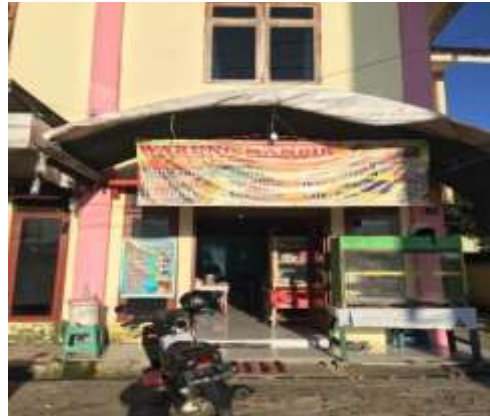
Gambar.3 Layout Toko