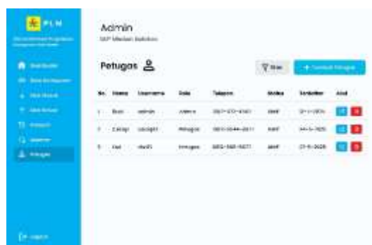
Gambar 12. Halaman Petugas

Pengelolaan akun petugas difasilitasi melalui rancangan halaman petugas. Halaman ini dirancang khusus untuk mengatur data akun petugas, seperti penambahan, perubahan, dan pengelolaan informasi petugas. Perancangan halaman ini bertujuan untuk memastikan pengelolaan akun petugas dapat dilakukan secara terstruktur sesuai dengan kewenangan yang diberikan.