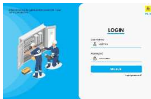
Gambar 5. Halaman Login

Tampilan halaman login dirancang sebagai pintu masuk sistem. Halaman ini berfungsi untuk memastikan bahwa hanya pengguna yang memiliki akun dan hak akses tertentu yang dapat mengakses sistem. Pengguna diharuskan memasukkan username dan password sebelum menggunakan fitur yang tersedia. Perancangan halaman login bertujuan untuk mendukung keamanan data serta membatasi akses sesuai dengan peran pengguna.