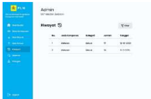
Gambar 10. Halaman Riwayat

Riwayat transaksi komponen ditampilkan melalui rancangan antarmuka yang menyajikan data historis penggunaan komponen. Halaman ini memungkinkan pengguna untuk meninjau kembali aktivitas pencatatan yang telah dilakukan sebelumnya. Fitur riwayat transaksi diharapkan dapat membantu proses monitoring dan evaluasi penggunaan komponen.