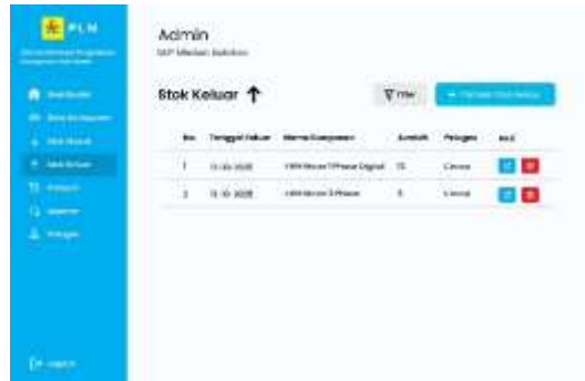
Gambar 9. Halaman Stok Keluar

Antarmuka stok keluar dirancang untuk mencatat distribusi atau penggunaan komponen. Halaman ini memuat informasi komponen yang digunakan, termasuk waktu dan petugas pencatat. Perancangan halaman ini bertujuan untuk meningkatkan ketertelusuran penggunaan komponen dalam kegiatan operasional.