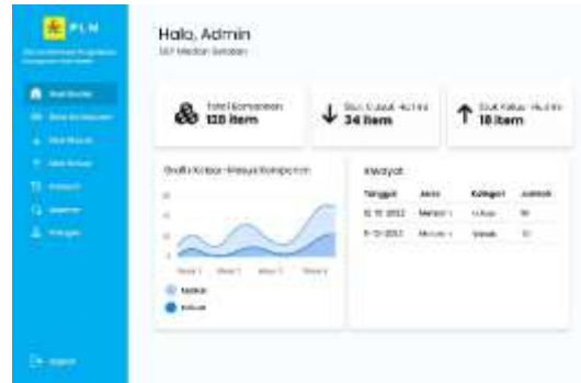
Gambar 6. Halaman Dashboard

Pada dashboard sistem ditampilkan rancangan halaman utama setelah pengguna berhasil melakukan login. Dashboard dirancang untuk menyajikan ringkasan informasi penting, seperti jumlah data komponen, status ketersediaan barang, serta menu navigasi menuju fitur utama sistem. Perancangan dashboard bertujuan untuk memudahkan pengguna memperoleh gambaran umum kondisi data komponen secara cepat dan efisien.