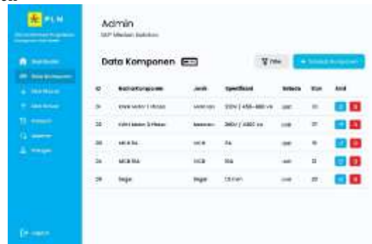
Gambar 7. Halaman Data Komponen

Halaman data komponen menampilkan rancangan antarmuka yang digunakan untuk mengelola data KWh meter, MCB, dan segel. Pada halaman ini, pengguna dapat melihat daftar komponen yang tersimpan dalam sistem beserta informasi pendukungnya. Perancangan halaman ini bertujuan untuk mempermudah proses pendataan dan pencarian komponen secara terstruktur dibandingkan pencatatan manual.