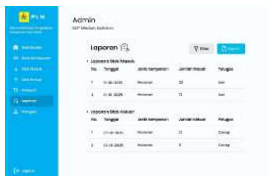
Gambar 11. Halaman Laporan

Penyajian laporan difasilitasi melalui rancangan halaman laporan yang menampilkan rekapitulasi data penggunaan dan ketersediaan komponen. Halaman ini dirancang untuk menyediakan fitur ekspor laporan