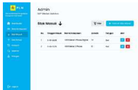
Gambar 8. Halaman Stok Masuk

Rancangan halaman stok masuk digunakan untuk mendokumentasikan setiap penambahan komponen ke gudang. Halaman ini dirancang agar proses pencatatan dapat dilakukan secara sistematis sehingga data stok