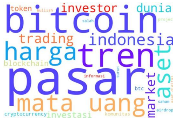
Gambar 2. Word Cloud Netral

Hasil analisis menunjukkan bahwa terdapat 75,6% tweet yang mendapatkan sentimen netral dari pengguna. Hasil analisis juga menunjukkan bahwa persepsi pengguna yang mengarah pada sentimen netral mengacu pada kata “pasar”, “bitcoin”, “tren”, “aset”, dan “harga”. Kata asosiasi “pasar” mencerminkan minat investor dan pergerakan harga dalam diskusi netral, tetapi dengan elemen positif. “Bitcoin” dibahas dalam konteks global, yang menunjukkan topik tersebut dikenal luas. Kata “tren” berkaitan dengan relevansi global dan respons publik terhadap perkembangan mata uang kripto. “Aset” Mengacu pada mata uang kripto dan token digital, yang mewakili adopsi dan pengaruh globalnya. “Harga” sering dikaitkan dengan aktivitas yang mendorong perubahan, dengan komunitas yang berpartisipasi dalam persepsi harga. Secara keseluruhan, diskusi kripto bersifat netral, tetapi mencakup minat yang luas pada pergerakan harga dan adopsi aset digital global.