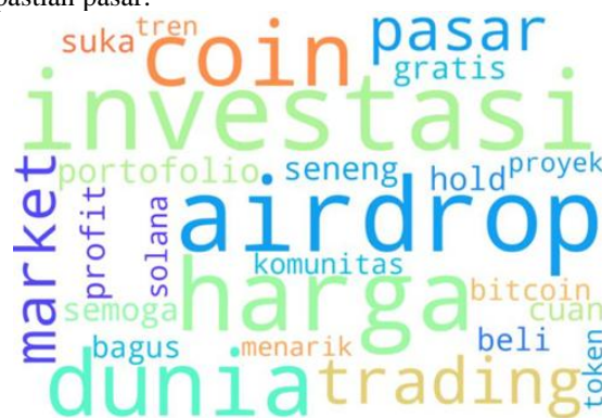
Gambar 3. Word Cloud Positif

Temuan ini sesuai dengan teori perilaku konsumen Razak (2016) yang menekankan faktor internal seperti pengetahuan dan sumber daya konsumen dalam pengambilan keputusan. Pengetahuan tentang mata uang kripto, seperti cara pembelian dan penggunaannya, masih terbatas di kalangan masyarakat sehingga menimbulkan sikap netral dalam diskusi daring. Selain itu, kepribadian dan gaya hidup seseorang juga memengaruhi tingkat keterlibatannya dalam pasar mata uang kripto. Dominasi sentimen netral mencerminkan sikap “ wait and see ”, yaitu masyarakat lebih memilih mengamati perkembangan pasar dan teknologi sebelum mengambil keputusan investasi. Sesuai dengan teori sinyal menurut Fahmi, (2014) pendekatan ini merupakan strategi untuk menghindari risiko besar di tengah ketidakpastian pasar.