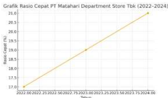
Gambar 2. Grafik Tren Rasio Cepat 2022 – 2024