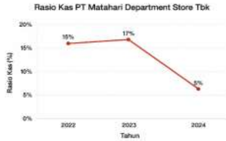
Gambar 3. Grafik Tren Rasio Kas 2022 – 2024

Fluktuasi Ketiga Rasio Likuiditas Tersebut Menunjukkan Bahwa Meskipun Perusahaan Berada Dalam Kondisi Likuid, Efisiensi Pengelolaan Aset Lancar Masih Perlu Ditingkatkan. Peningkatan Rasio Lancar Dan Cepat Diikuti Dengan Penurunan Rasio Kas Mengindikasikan Adanya Dana Menganggur Yang Belum Dimanfaatkan Secara Optimal. Stabilitas Likuiditas Perusahaan Masih Dipengaruhi Oleh Pergerakan Aset Lancar Yang Tidak Konsisten.