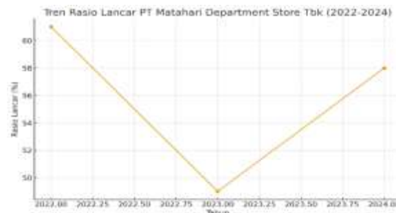
Gambar 1. Grafik Tren Rasio Lancar 2022 – 2024