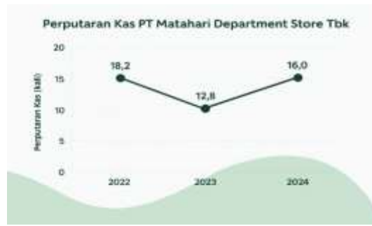
Gambar 5. Grafik Perputaran Modal Kas 2022 – 2024