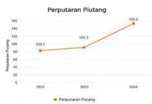
Gambar 6. Grafik Perputaran Modal Piutang 2022 – 2024