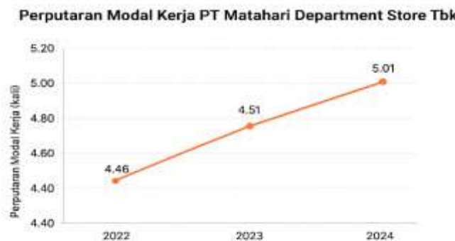
Gambar 4. Grafik Perputaran Modal Kerja 2022 – 2024