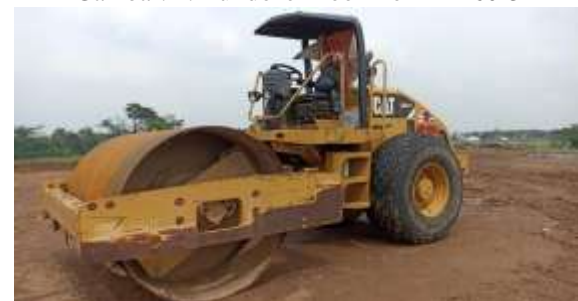
Gambar. 4. Vibro Roller Caterpillar CS533E