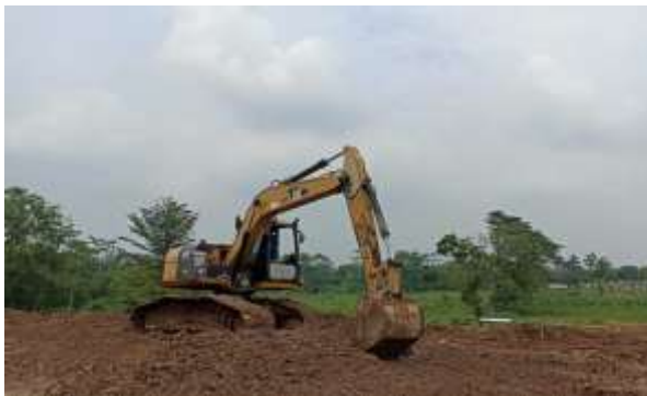
Gambar. 1. Excavator Caterpillar 313D