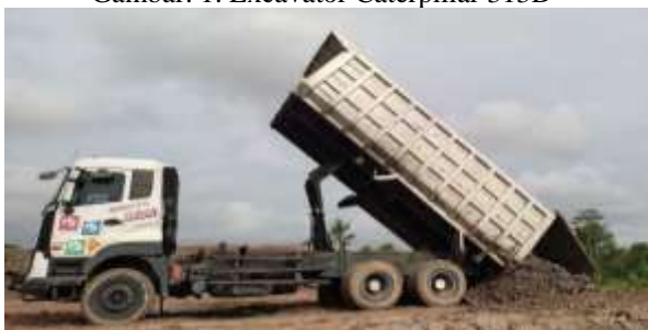
Gambar. 3. Dump Truck UD Quester GWE 6×4