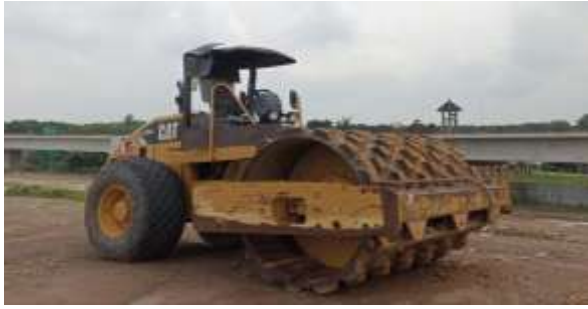
Gambar. 5. Sheepfoot Roller Caterpillar CS533E

Penyamaan jumlah dan jenis alat pada setiap alternatif dilakukan untuk mengontrol variabel kuantitas armada, sehingga evaluasi COPRAS berfokus sepenuhnya pada pengaruh kondisi alat terhadap kriteria penilaian, yaitu biaya operasional, mutu pekerjaan, risiko operasional, dan waktu pelaksanaan. Dengan pendekatan ini, perbedaan kinerja yang dihasilkan antar alternatif tidak disebabkan oleh jumlah unit alat, melainkan oleh karakteristik teknis dan ekonomis armada yang berbeda antara penggunaan alat baru, alat lama, maupun kombinasi keduanya.