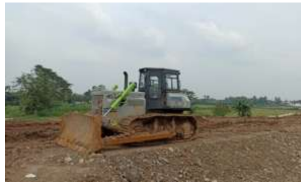
Gambar. 2. Bulldozer Zoomlion ZD160-3