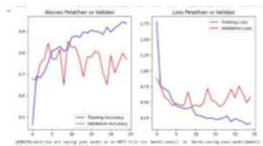
Gambar 1. Grafik Perbandingan Akurasi dan Loss pada Data Pelatihan dan Validasi Model CNN

Loss: 0,17–0,25 (training), 0,50–0,58 (validation)