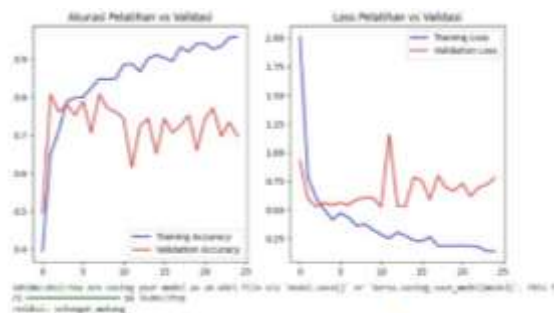
Gambar 2. Grafik Perbandingan Akurasi dan Loss pada Data Pelatihan dan Validasi Model CNN

Loss: 0,12–0,23 (training), 0,68–0,78 (validation)