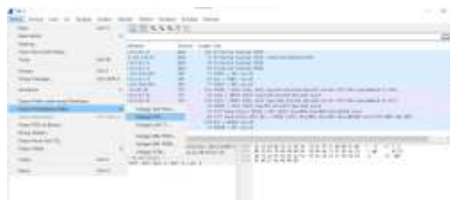
Gambar 5. Pengekspor File ke CSV

Berikut gambar menunjukkan cara ekspor file ke csv agar dapat dirumuskan menggunakan excel: