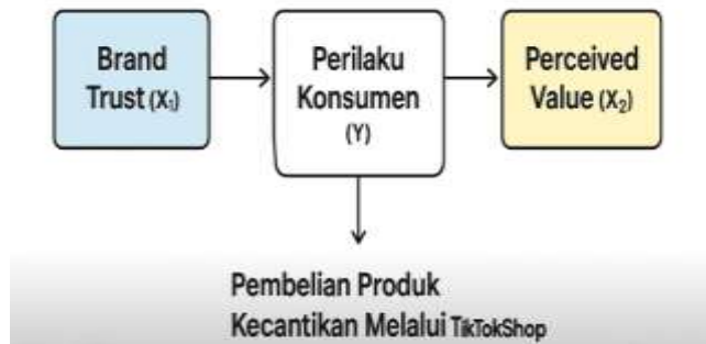
Gambar 1: Kerangka Konseptual

Visualisasi hubungan antar variabel sebagai berikut: