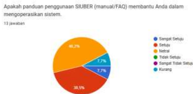
Gambar 7. Hasil Distribusi Jawaban

Pertanyaan: “Apakah panduan penggunaan SIUBER membantu Anda mengoperasikan sistem?”