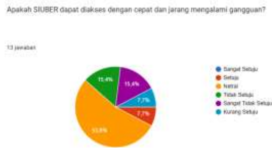
Gambar 4. Hasil Distribusi Jawaban

Pertanyaan: “Apakah SIUBER dapat diakses dengan cepat dan jarang mengalami gangguan?”