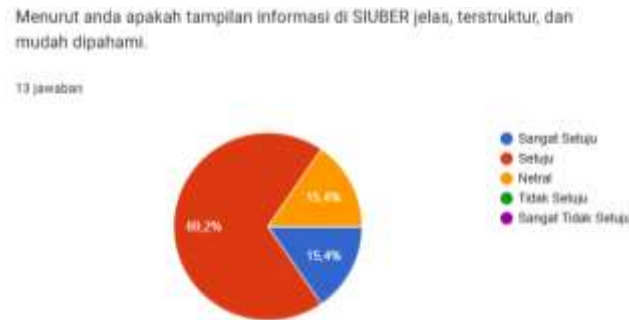
Gambar 6. Hasil Distribusi Jawaban

Pertanyaan: “Apakah tampilan informasi di SIUBER jelas, terstruktur, dan mudah dipahami?”