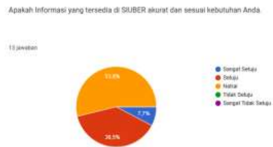
Gambar 5. Hasil Distribusi Jawaban

Pertanyaan: “Apakah informasi yang tersedia akurat dan sesuai kebutuhan Anda?”