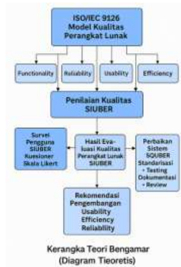
Gambar 1. Diagram Kerangka Teori (Mermaid Diagram)

Pada penelitian ini, skala Likert digunakan untuk menilai setiap karakteristik dalam ISO/IEC 9126, sehingga dapat menggambarkan persepsi pengguna terhadap kualitas SIUBER secara terukur dan objektif [10].