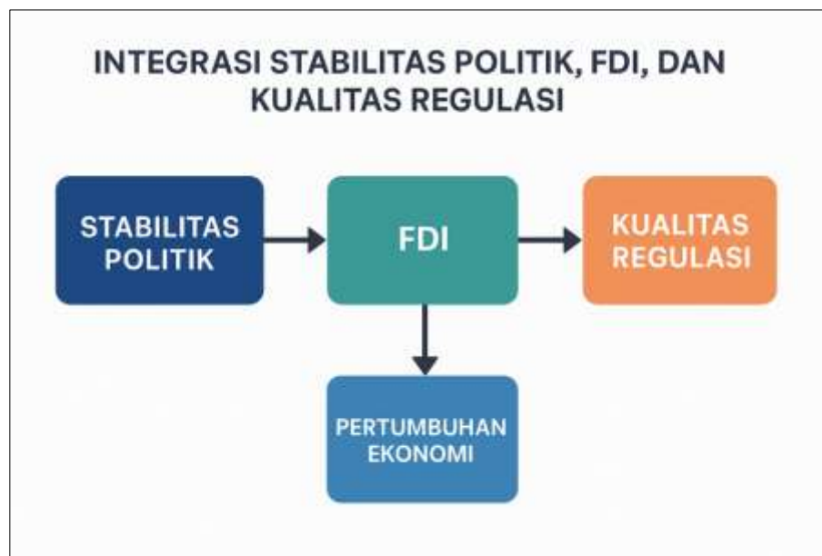
Gambar 4.1. Integrasi Stabilitas Politik, FDI, dan Kualitas Regulasi