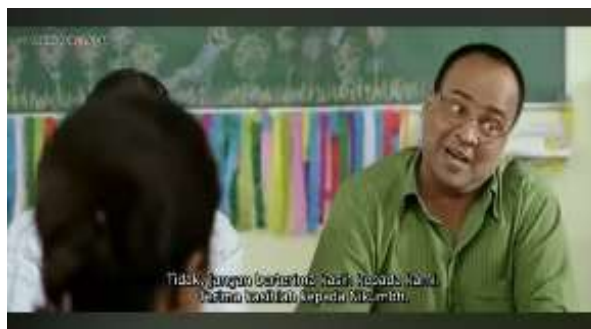
Gambar 7. Scene 7 (2:33:00)

Level realitas pada scene ini dapat dilihat dari kostum yang digunakan Sen Sir yaitu kemeja lengan pendek berwarna hijau. Warna hijau pada kemeja Sen Sir melambangkan kesuburan dan kesalihan tinggi (Suhandra, 2019). Warna hijau dianggap memiliki tingkat daya tarik yang lebih dalam hal kesan misteri dibandingkan dengan warna putih, meskipun keduanya juga sering dikaitkan dengan kesucian.