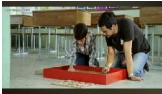
Gambar 2. Scene 2. (2:03:35)

melihat situasi dari perspektif yang sejajar dengan karakter. Teknik ini memperjelas emosi ibu Ishaan serta memberikan kedekatan psikologis dengan tokoh, sehingga penonton dapat merasakan ketegangan yang terjadi (Aryanto et al., 2023). Pada level ideologi, scene ini memuat pesan pascakolonialisme dan apatisisme. Pascakolonialisme tercermin dari tekanan sosial yang menuntut anak mengikuti standar pendidikan tertentu tanpa memahami keragaman kemampuan, seolah nilai akademik menjadi satu-satunya tolok ukur keberhasilan. Ishaan berjuang untuk diterima di lingkungan yang tidak memahami kondisi disleksianya. Sementara itu, ideologi apatisisme tampak dari sikap ibu Ishaan yang lebih fokus pada ketakutannya terhadap prestasi sekolah daripada memahami kesulitan nyata yang dialami anaknya.