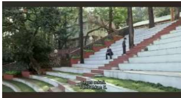
Gambar 4. Scene 4 (2:05:15)

Level ideologi yang ditunjukkan dalam scene ini merupakan individualisme, humanisme, dan pluralisme. Ideologi individualisme pada gambar atas adalah pentingnya pengakuan terhadap keunikan dan kebutuhan individu dalam proses pendidikan, serta memberikan ruang bagi ekspresi dan pengembangan diri. Individualisme sendiri adalah suatu paham yang menganggap manusia sendiri secara pribadi perlu diperhatikan (kesanggupan dan kebutuhan tidak boleh disamaratakan) (AM, 2018). Selain itu ideologi humanisme yang ditunjukkan pada gambar ini melalui Ram Shankar Nikumbh yang sedang mengajari salah satu muridnya yang mengidap penyakit disleksia membaca dengan baik dan benar. Ideologi pluralisme juga diperlihatkan pada gambar ini melalui Ram Shankar Nikumbh yang dapat merangkul murid nya dengan cara belajar yang menyenangkan.