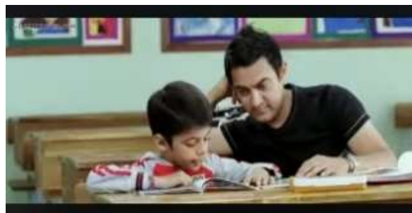
Gambar 3. Scene 3 (2:05:05)

Level ideologi yang di tunjukan pada scene ini adalah pluralisme dan humanisme. Pluralisme adalah paham atau ideologi yang menerima keberagaman sebagai nilai positif dan keragaman itu merupakan sesuatu yang empiris (Lestari, 2020). Ideologi pluralisme ini di tunjukan pada scene ini ketika Ram Shankar Nikumbh dapat menghargai dan merangkul keberagaman, baik dalam hal bakat dan kecerdasan yang dimiliki oleh Ishaan sebagai muridnya. Sedangkan ideologi humanisme yang dapat diambil pada scene ini adalah bagaimana Ram Shankar Nikumbh dapat memahami keunikan setiap individu, serta memberikan kesempatan bagi Ishaan muridnya untuk berkembang sesuai dengan potensi mereka. Humanisme sendiri memiliki arti yaitu suatu pemikiran filsafat yang menjunjung tinggi nilai-nilai dan kedudukan manusia serta menjadikannya sebagai kriteria segala sesuatu (Hadi, 2012).