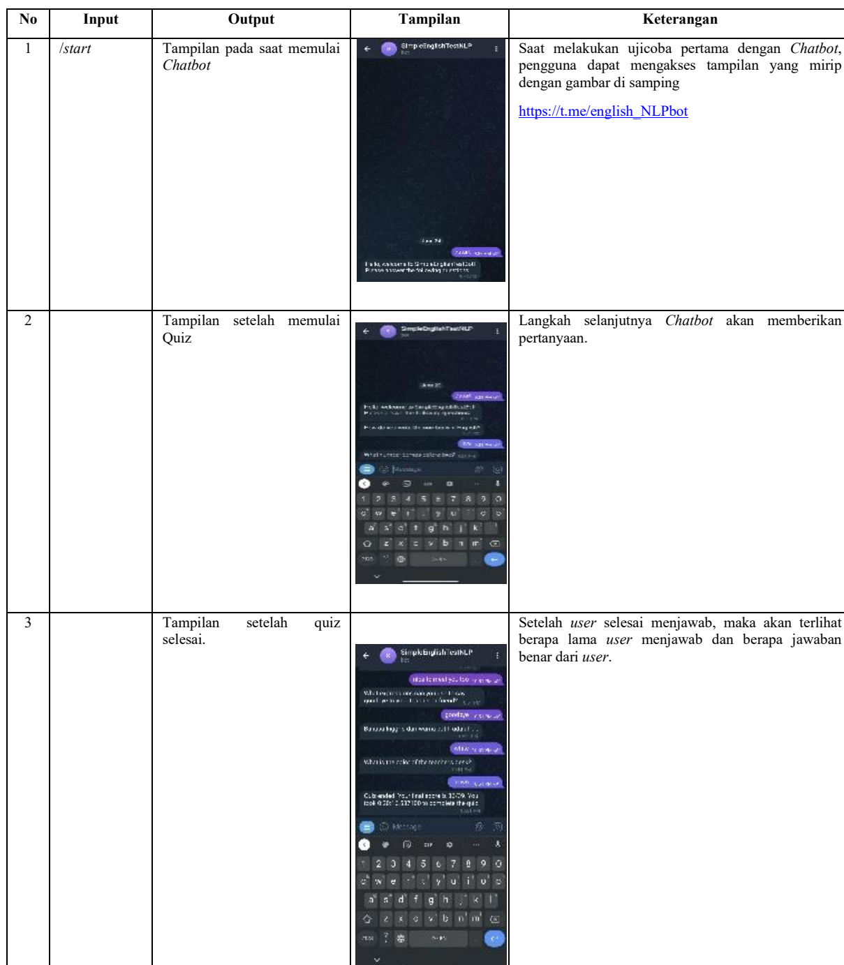
Tabel 1. Tampilan Chatbot

Tabel 1 menunjukkan alur interaksi antara pengguna dan sistem chatbot mulai dari tahap awal hingga proses evaluasi akhir. Pada baris pertama terlihat bahwa ketika pengguna mengetik perintah start chatbot akan menampilkan antarmuka awal yang berfungsi sebagai pengenalan sistem. Tampilan ini memberikan instruksi singkat mengenai cara memulai kuis sehingga pengguna dapat memahami langkah penggunaan sebelum memasuki sesi pertanyaan. Antarmuka awal ini juga memastikan bahwa sistem aktif dan siap menerima input dari pengguna.