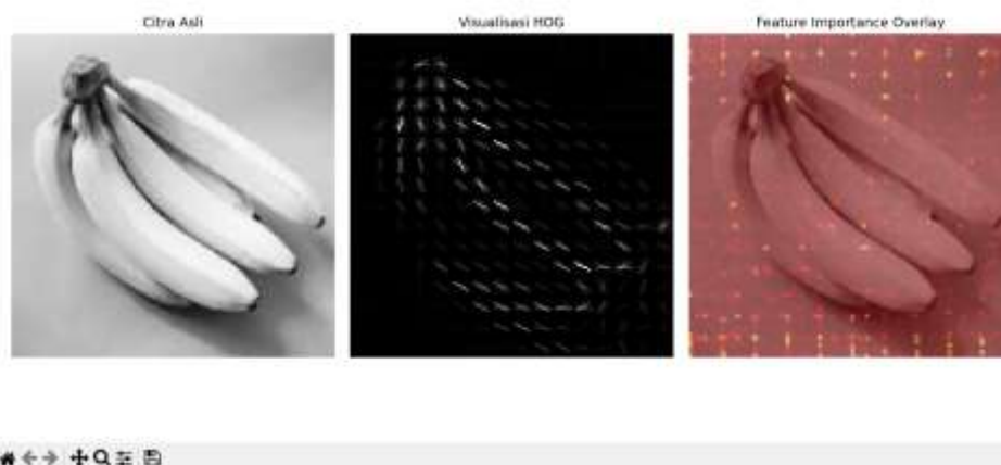
Gambar 3.2 Visualisasi Citra Asli, HOG, dan Feature Importance Overlay

Visualisasi ini menunjukkan bahwa model fokus pada area dengan tekstur dan pola khas seperti tepi objek atau area dengan perubahan kontras yang signifikan. Hal ini membuktikan bahwa fitur yang diekstraksi melalui HOG mampu menangkap informasi penting yang relevan dengan perbedaan antar kelas citra.