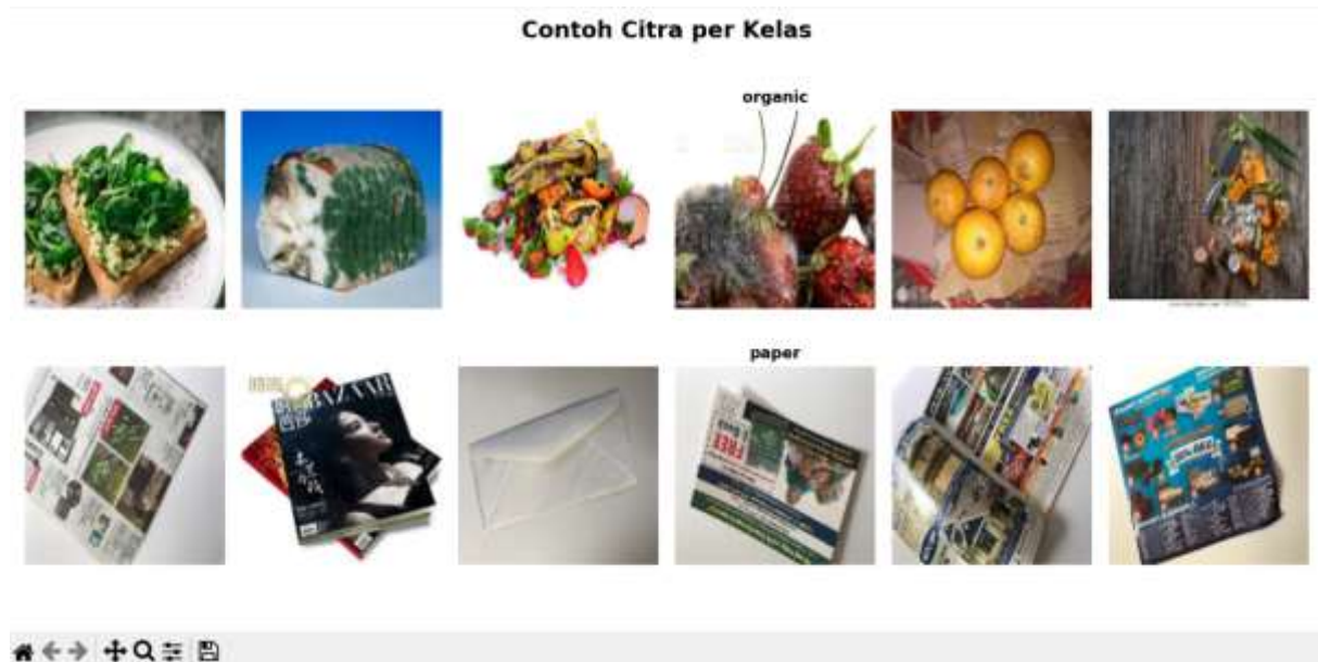
Gambar 3.1 Contoh Citra per Kelas (Organic dan Paper)