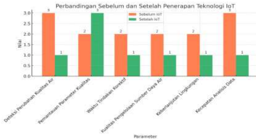
Gambar 3.2 Perbandingan Sebelum dan Setelah Penerapan Teknologi IoT