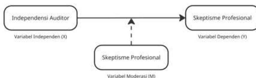
Gambar 1. Kerangka Konseptual