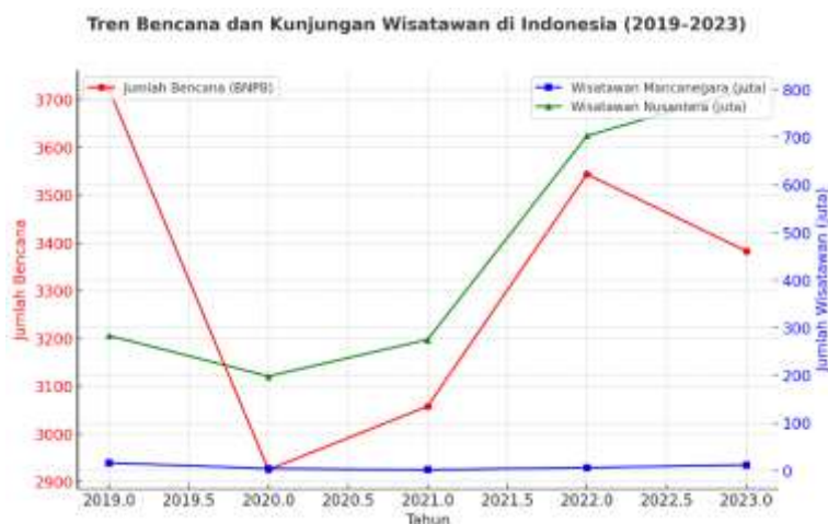
Gambar 2. Tren jumlah bencana dan kunjungan wisatawan di Indonesia 2019–2023

Keterkaitan erat antara bencana dan pariwisata di Indonesia dapat dilihat melalui data BNPB dan Kemenparekraf dalam periode 2019–2023. Selama lima tahun terakhir, jumlah bencana tercatat relatif stabil di atas 3.000 kejadian per tahun, sementara jumlah wisatawan mancanegara dan nusantara menunjukkan fluktuasi yang signifikan. Tahun 2020 mencatat penurunan drastis kunjungan wisatawan mancanegara hingga hanya 4 juta akibat pandemi COVID-19, sementara wisatawan nusantara juga turun menjadi 198 juta. Pada tahun 2022 dan 2023, angka kunjungan wisatawan kembali meningkat, namun tingkat kerentanan tetap tinggi karena bencana terus terjadi.