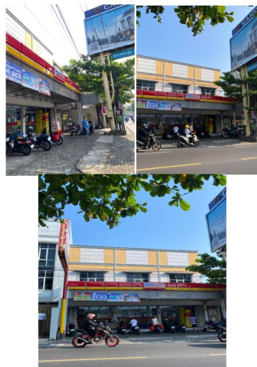
Gambar 1. Lokasi Tempat Penelitian

Penelitian ini dilakukan di Alfamart Jalan Dr. Wahidin No. 123 Kota Semarang, dengan durasi penelitian selama dua bulan, yaitu mulai bulan Maret hingga April 2025. Peneliti melakukan wawancara dan observasi langsung pada karyawan selama periode ini untuk mengumpulkan data yang relevan dan akurat mengenai pengaruh disiplin kerja dan kompensasi terhadap kinerja karyawan.