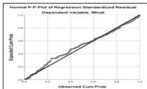
Gambar 1. Hasil Uji Probability Plot

Sebelum dilakukan interpretasi model regresi, pengujian terhadap pengecekan asumsi statistik diperlukan untuk validasi model statistik dasar. Dua asumsi utama yang diuji adalah normalitas residual dan homoskedastisitas.