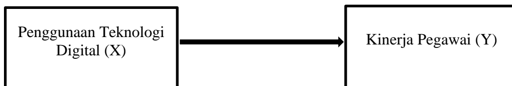
Gambar 1. Kerangka Konseptual