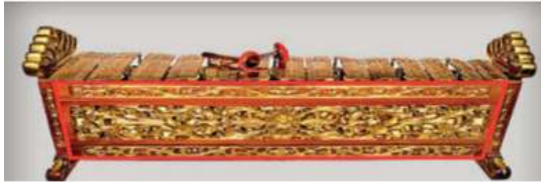
Gambar 5. Rancakan (Agustin, 2019)

Konsep matematika tentang bangun datar trapesium dapat diaplikasikan dengan memahami bagian rancangan dari alat musik gamelan gender. Trapesium yang berada di bagian rancangan ini merupakan jenis trapesium sama kaki. Rancangan adalah wadah pada perangkat gender yang terbuat dari kayu untuk meletakkan bumbungan, wilahan, dan bagian-bagian gender lainnya. Rancangan ini biasanya terbuat dari kayu yang dapat diukir dengan motif sesuai yang diinginkan (Sadono, 2015). Konsep matematika tentang bangun datar trapesium juga dapat diaplikasikan pada alat musik gamelan yang lain. Yakni alat musik gamelan rebab dan siter. Untuk itu dalam pembelajaran matematika, kita dapat mengukur panjang dan tingginya, lalu menghitung luas dan kelilingnya.