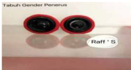
Gambar 6. Tabuh (Collection, 2024)