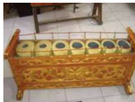
Gambar 7. Bumbungan (Saptono, 2017)

Tabuh merupakan sebuah instrumen pukul yang berbentuk lingkaran yang dipakai untuk bermain alat musik gender dalam ansambel gamelan. Tabuh gender memiliki lingkaran dengan diameter rata-rata sekitar 5 cm dan pegangan yang panjangnya seukuran dengan telapak tangan laki-laki dewasa. Secara umum, tabuh gender sering kali dibuat dari kemuning, kayu sono keling, sawo, atau galih asem. Bagian luar lingkaran tabuh sering dilapisi dengan kain yang dikenal dengan istilah “bêbêt” atau “blêbêt”, yang biasanya terbuat dari bahan kain atau karet (Sadono, 2015). Kemudian pada tabung resonator-resonator yang dipasang secara vertikal disebut bumbungan. Bumbungan ini banyaknya ada 7, dengan ketebalan yang berbeda-beda supaya menghasilkan suara yang berbeda. Sehingga ukuran diameternya juga akan berbeda-beda. Karena bumbungan ini berbentuk tabung, sudah dapat dipastikan bahwa bagian atasnya memiliki bentuk lingkaran. Lingkaran tersebut biasanya terbuat dari bambu atau logam (Primamona, 2022). Sehingga dalam pembelajaran matematika, kita dapat mengukur jari-jari, diameter, luas, keliling, tali busur, dan juring dari unsur lingkaran yang ada pada alat musik gender.