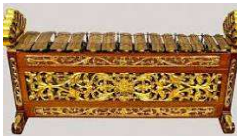
Gambar 1. Gender (Agustin, 2019)

Artikel ini menunjukkan bahwa gamelan gender Jawa dapat menjadi sumber inspirasi untuk menggali unsur-unsur matematika. Meskipun gamelan gender adalah sebuah bentuk seni, namun terdapat aspek-aspek matematika yang dapat dihubungkan dengan konteks kehidupan sehari-hari. Gender merupakan sebuah instrumen musik pukul logam yang terdiri dari 10 hingga 14 bilah kuningan yang digantung pada sebuah berkas, yang ditempatkan di atas resonator yang terbuat dari bambu atau seng. Instrumen ini dimainkan dengan menggunakan pemukul berbentuk bundar yang terbuat dari kayu yang dilapisi kain. Nada-nadanya bervariasi, tergantung pada tangga nada yang digunakan. Dalam gamelan Jawa yang lengkap, terdapat tiga jenis gender: slendro, pelog pathet nem dan lima, serta pelog pathet barang. Bentuk dari gender menyerupai slenthem dalam gamelan Jawa (Ensiklopedia Dunia, n.d.).