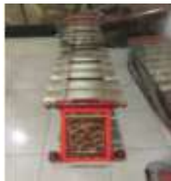
Gambar 4. Rancangan Sisi Kanan dan Kiri (instrument, 2024)

Bagian gender yang terdiri dari 10-14 bilah logam yang terbuat dari perunggu, besi, atau kuningan dinamakan wilahan. Wilahan ditegangkan pada bingkai kayu dan diletakkan merentang di atas resonator-resonator (Primamona, 2022). Dilihat dari gambar 2, gamelan gender pada semua bagian wilahan memiliki bentuk yang sama seperti bangun datar persegi panjang dengan variasi ukuran panjang 28 - 34 cm, dengan lebar yang sama. Hal ini gunanya untuk melaraskan dan mempengaruhi besar frekuensi nada (Nuzul & Mitrayana, 2017). Pada gambar 3 yaitu bagian srawung atas dan srawung bawah, memiliki bentuk seperti bangun datar persegi panjang dengan ukuran panjang dan lebar yang sama. Lalu pada bagian sisi samping kanan dan kiri gamelan gender seperti gambar 4 juga memiliki bentuk bangun datar persegi panjang dengan ukuran panjang dan lebar yang sama. Untuk aplikasi dalam pembelajaran kita dapat menemukan luas dan keliling dari persegi panjang tersebut.