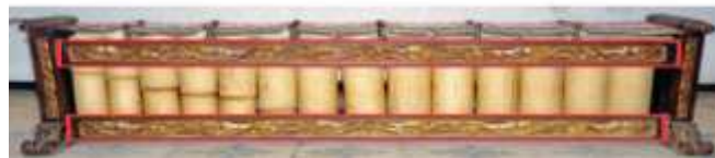
Gambar 3. Srawung (Elevate, 2021)