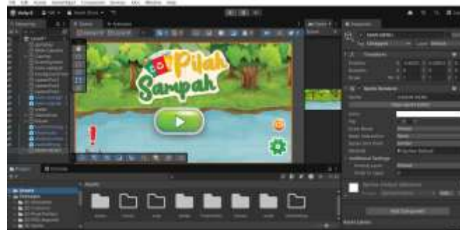
Gambar 3. Rancangan Main Menu

Pada tahap konstruksi, pengkodean game dilakukan menggunakan Unity sebagai game engine dengan bahasa pemrograman C#. Pemanfaatan Unity memungkinkan penambahan grafis yang lebih realistis serta elemen interaktif yang ditujukan untuk memperkuat pesan edukasi mitigasi banjir, bukan sekadar aspek estetika. Penyempurnaan antarmuka pengguna (UI) direncanakan melalui penggunaan ikon berwarna, tombol interaktif, serta animasi ringan untuk meningkatkan pengalaman bermain.