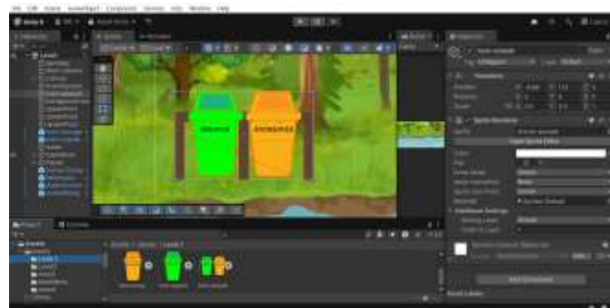
Gambar 4. Aset Games

Pengembangan game edukasi mitigasi banjir dimulai dengan tahap pembuatan aset utama berupa gambar dan audio. Aset gambar meliputi ikon sampah, tempat sampah, sungai, sekolah, dan elemen lingkungan lain yang relevan dengan konteks edukasi. Sementara itu, aset audio mencakup efek suara sederhana seperti suara “klik”, “seret”, atau peringatan saat pemain salah memasukkan sampah. Pembuatan aset ini bertujuan untuk memberikan pengalaman bermain yang lebih menarik dan realistis, sekaligus memperkuat pesan edukatif melalui visual dan audio.