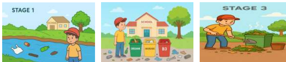
Gambar 5. Implementasi Games

Setelah aset gambar dan audio tersedia, tahap berikutnya adalah perakitan prototipe game dengan mengintegrasikan berbagai fitur ke dalam alur permainan. Mekanisme drag-and-drop digunakan untuk memfasilitasi interaksi pemain saat memilah sampah, sedangkan indikator skor dan progres ditambahkan untuk memberi umpan balik langsung terhadap kinerja pemain. Selain itu, umpan balik visual berupa perubahan warna serta audio berupa suara penanda benar atau salah diimplementasikan agar pemain lebih mudah memahami konsekuensi dari setiap aksi. Prototipe yang dihasilkan merepresentasikan alur tiga stage utama, yaitu pemilahan sampah di sungai, lingkungan sekolah, dan pembuatan kompos.