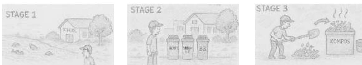
Gambar 2. Storyboard

Ketika pemain mengetuk tombol "Mulai", mereka akan diarahkan ke halaman pemilihan stage. Halaman ini menampilkan empat tombol yang merepresentasikan tiga tahapan permainan dan satu tombol untuk kembali ke menu utama. Setiap tombol tahap permainan ditampilkan dalam bentuk ikon bertema lingkungan, seperti ikon sungai, tempat sampah, dan daun untuk mempermudah pemain memahami konteks setiap stage.