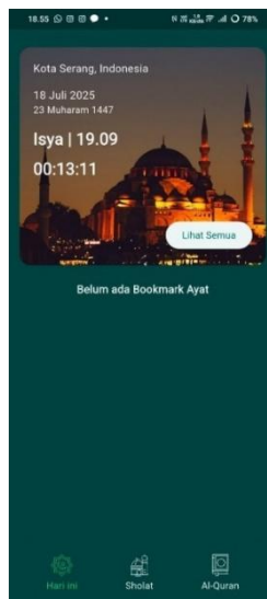
Gambar 1. Menu Home Aplikasi Al-Quran Digital

Untuk memulai akses terhadap Aplikasi Al-Qur'an Digital, (1) buka aplikasi melalui smartphone dengan mencari dan menyetuk ikon Aplikasi Al-Qur'an Digital. (2) Setelah aplikasi dibuka, akan muncul tampilan awal berupa halaman utama (home) yang menyajikan berbagai menu seperti daftar surah, terjemahan, dan jadwal salat, sehingga memudahkan pengguna dalam menggunakan fitur yang tersedia.